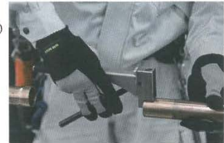
(写真 3 専用工具による窒素ガス封入口の穴あけ)