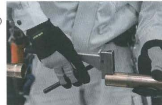
(写真 3 専用工具による窒素ガス封入口の穴あけ)