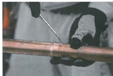
(写真 2 窒素ガス封入)