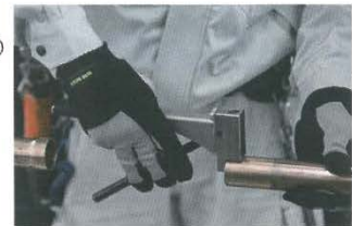
(写真 3 専用工具による窒素ガス封入口の穴あけ)